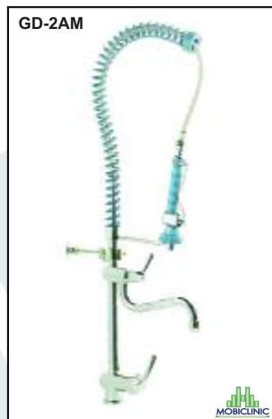
Grifo 2 aguas con caño y monomando.