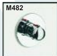
Válvula termostática empotrable en pared