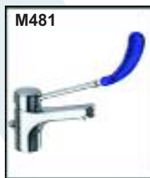
Grifo monomando palanca codo para fregadero