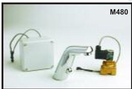
Grifo para lavabo infrarrojo