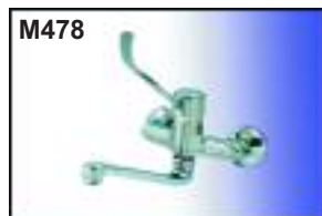
Grifo mezclador medical